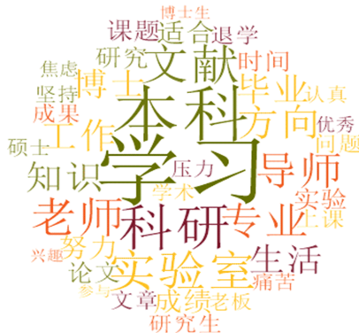
图 1 网络文本词云图

根据词云图结果(图 1)，“学习”“科研”“实验室”“文献”等词汇的出现频率较高,反映了低年级直博生在知识学习、文献阅读、研究开展等方面存在不适问题;而“本科”一词表明他们对自我经历的回溯与对比。但词云图仅能粗略反映直博生学业不适的焦点,无法透视词汇间的关联性及其表达的内容细节。对此,本研究通过质性访谈进一步细化低年级直博生学业不适的背后逻辑及形成机理。