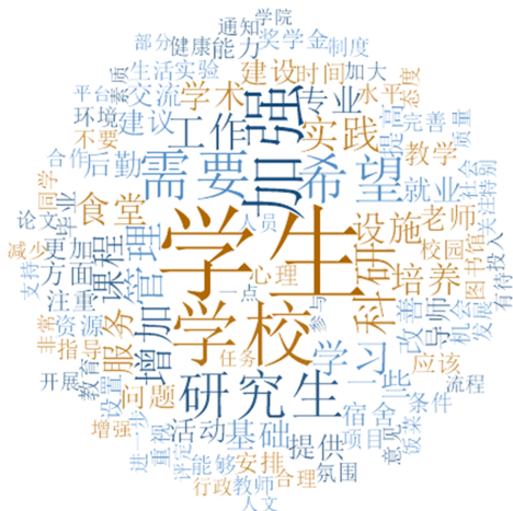
图2 研究生满意度开放题关键词词云图

为深入了解学生对研究生教育的满意程度及其背后缘由,调查设置专项多选题与开放题。对研究生满意度开放题的回答文本进行近义词归纳分析,例如“帮忙”“帮助”“对待”“服务”等近义词统一归纳为“服务”,最终制成图2所示的研究生满意度开放题关键词词云图。图2可看出,“学生”“学校”“研究生”“加强”“科研”“管理”“工作”“学习”“实践”“食堂”“设施”“课程”“服务”等成为研究生希望研究生教育改进的关键词。客观题中满意度得分的题也与开放题回答情况较为一致,其中,研究生教育就业、跨学科研究生培养、学校管理、国际交流与合作等不尽如人意,需要得到更多的关注。